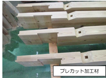
プレカット加工材