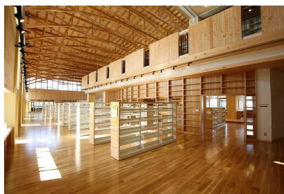
茂木町 ふみの森もてぎ

茂木町における地域材を活用した事例である「ふみの森もてぎ」「茂木中学校」の取組事例の紹介